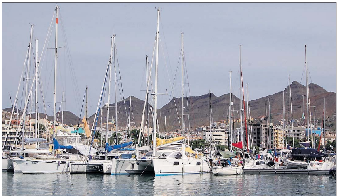
«Fri Inspirasjon» til høgre i biletet syner at ein ikkje treng stor og dyr båt for å segle heilt til Karibia.